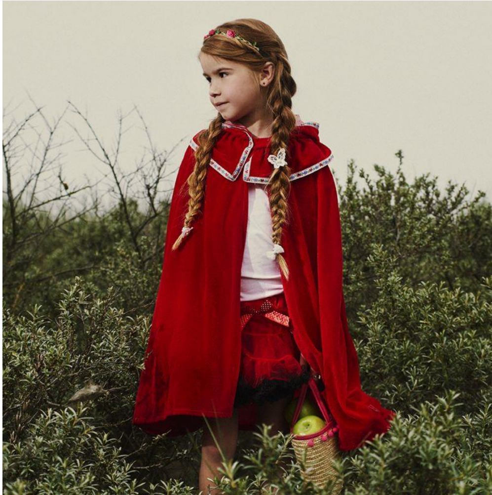
De eerste mantelzorg, dat was roodkapje